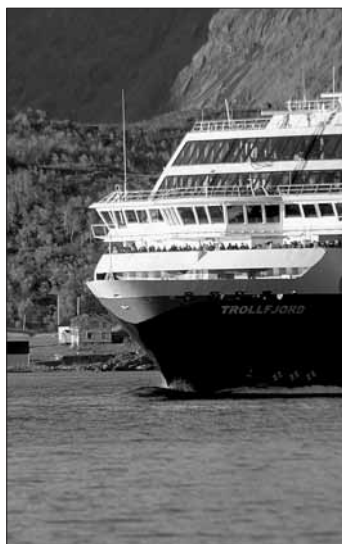
MS «Trollfjord» i Raftsundet.